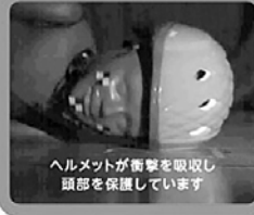
ヘルメットが衝撃を吸収し頭部を保護しています