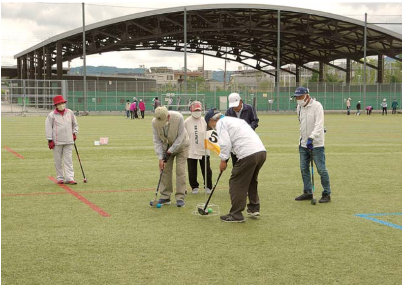
腕に覚えのある選手のみなさんが熱いプレーを展開

陽春の春日和...とい うよりは、どんより曇 りの、時たまシ・ビ・ シ・ビ雨天気! そんな天気もなんの その、グラウンド・ゴ ルフ大会が開催されま した。 腕に自信の猛者ばか り、1ラウンド終了時