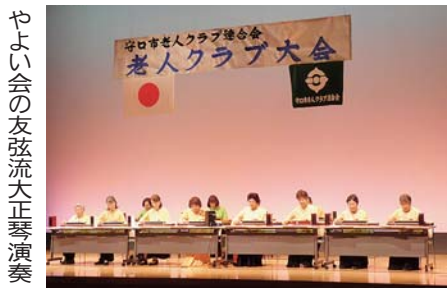
やよい会の友弦流大正琴演奏

本年度の感謝状受賞者は15名、金婚受賞者は12組(24名)、米寿受賞者は193名、白寿受賞者は11名の総計243名でありました。