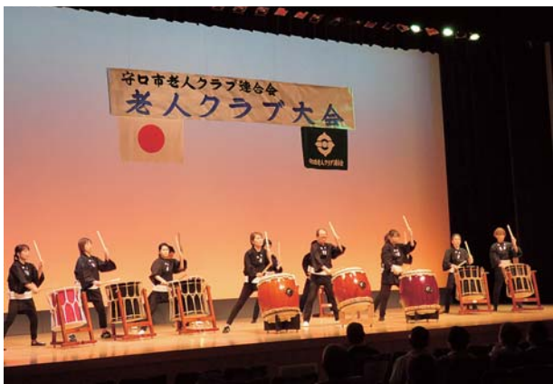
鼓屋集団による和太鼓演奏が花を添える

授賞式典の後、受賞者のお祝いに「鼓屋集団」による素晴らしい「和太鼓演奏」、第二部では守口警察署生活安全課並びに大阪府警察本部交通安全教育班の講演、第三部においては、友弦流大正琴やよい会、三味線大庭会、3B体操のアトラクションで、華やかに大会を盛り上げて終了いたしました。