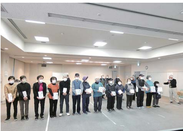
人気の公式ワナゲ大会に20チーム、総勢60人が参加

高齢者は苦手です。コ ロナ対策も2類から5 類へ緩和されました が、自助努力で引き続 き感染防止対策をお願 い致します。 「あゆみ」発行の投 稿も、会員の皆様に 「元気ですよ」の発信 にもなりますので、旅 行に行ったら事、今こ んなにしてんねん、独 り言でもいいです、思 のままの事を文章にし て投稿していただけたら と思います。 お待ちしております (広報部)