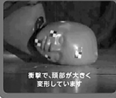
衝撃で、頭部が大きく変形しています