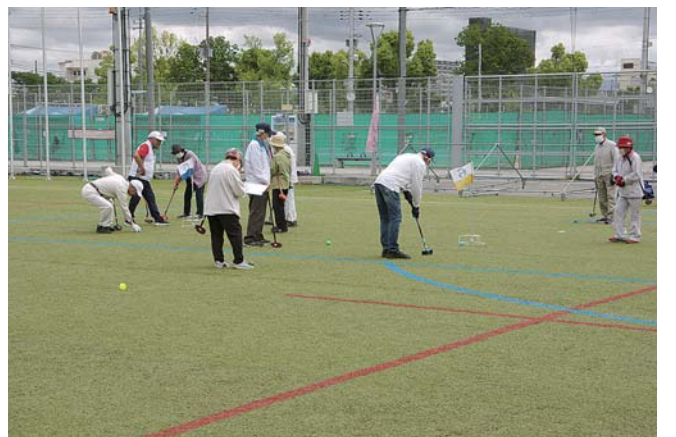
雨もよいの曇天にもめげず闘志満々のプレー