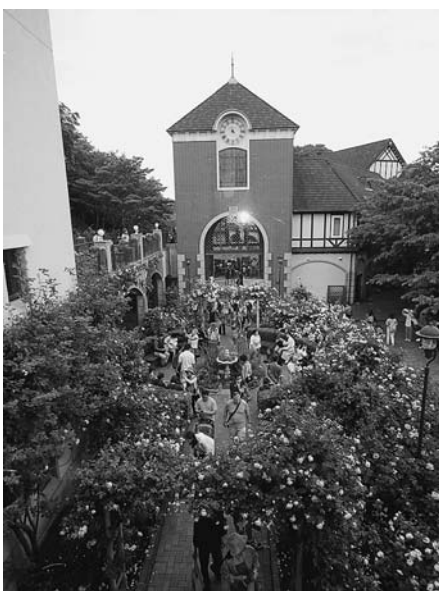
非日常の世界が楽しめる布引ハーブ園

バラが見ごろという事で見逃してはならないと思ひ立ち、すぐに出発。場所は新神戸駅の横からロープウェイで登りますが、街中から中間駅へと