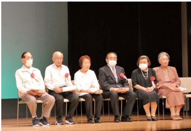
喜びの受賞者のみなさん