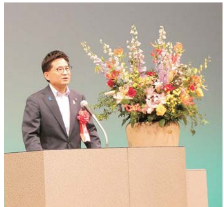
祝辞を述べる瀬野守口市市長