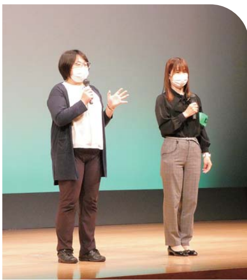
守口警察署から特殊詐欺被害防止についての講演も

本年度の感謝状受賞者は15名、金婚受賞者は12組(24名)、米寿受賞者は193名、白寿受賞者は11名の総計243名でありました。