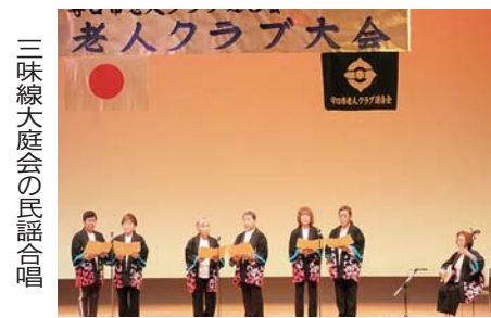
三味線大庭会の民謡合唱

授賞式典の後、受賞者のお祝いに「鼓屋集団」による素晴らしい「和太鼓演奏」、第二部では守口警察署生活安全課並びに大阪府警察本部交通安全教育班の講演、第三部においては、友弦流大正琴やよい会、三味線大庭会、3B体操のアトラクションで、華やかに大会を盛り上げて終了いたしました。