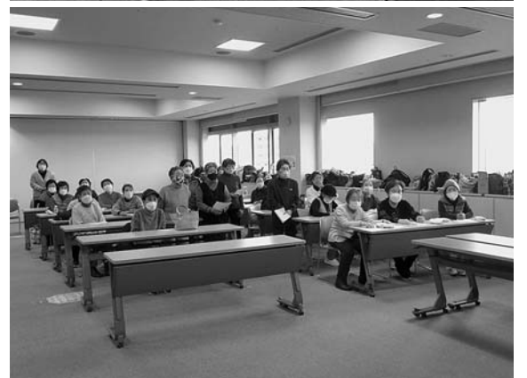
松下看護専門学校のみなさんと3年ぶりに楽しく交流