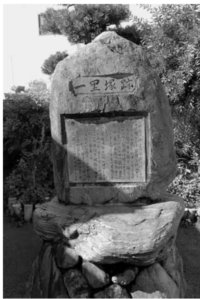
徳川秀忠が五街道整備時に小山を作ったのが始まり