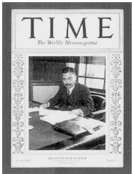
「タイム」1931年10月12日号表紙に掲載

使に就任する。1924年、世界一次大戦が終結し、アメリカの提案する国際軍縮会議(ワシントン条約)全権大使として出席し締結する。1924年(大正13年)加藤内閣で外務大臣に。その後若槻内閣まで4代に亘り外務大臣をつとめた。1920年代、彼は自由主義体制による国際協調路線を基本として「幣原外交」と称され国際的にも讃えられた。 対米英にはワシントン条約を基本とした列強協調を、アジアには日本を中心とした安定した秩序を形成すべきだと主張してきた。 1930年(昭和5年)、ロンドン海軍軍縮会議に全権として出席し、条約を締結する。すると軍部から柔軟外交だと突き上げられ一蹴され、独断横暴で満州事変が勃発する。もう文民外交路線は終焉し、軍閥体制へと移行してくる。若槻内閣は総辞職し、幣原は表舞台から遠ざかり下野に降る。 終戦を迎えついに首相に