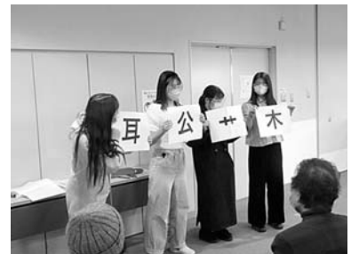
《脳トレ漢字クイズ》