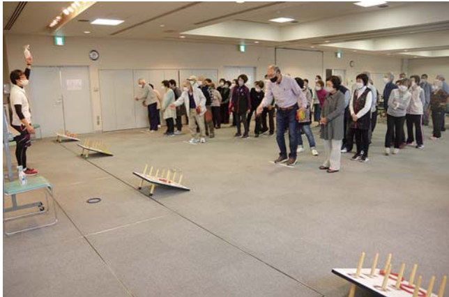
大好評だった初の公式ワナゲ講習会。感染対策も万全に