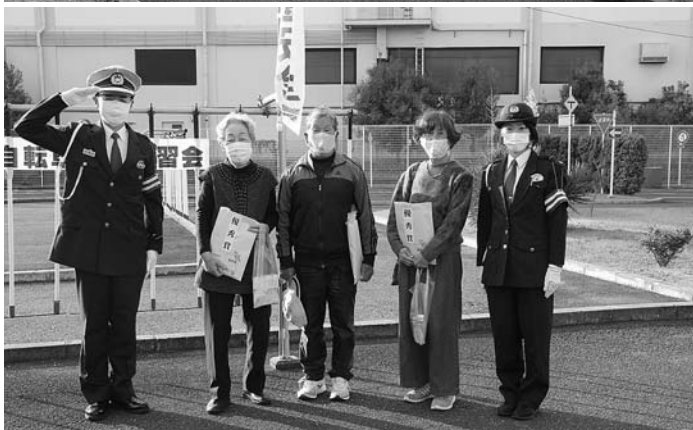
25名が熱心に受講、自転車事故ゼロをめざした