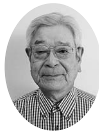
令和4年度より、守口市老人クラブ連合会副会長兼三郷ブ