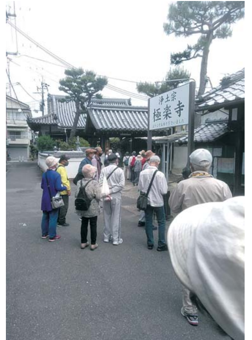
春分の日に弥治右衛門の追悼法要が行われる極楽寺

5月16日(月)、東部コミュニティセンターを起点として一五きほどの行程で、東部の一部(市指定文化財五カ所)を回るウォーキングを実施しました。普段は何も気付かずに行き来して見ている景色なのに、少し案内