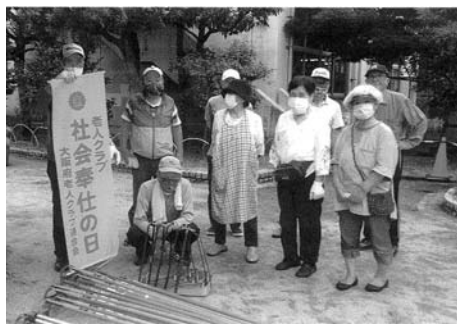
公園清掃は重要な活動

くから参加し、きれいな公園を後にします。60代・70代の方々は仕事を持っておられますので、なかなか入会者がありませんで、平均年齢80歳となりました。このコロナの終息が早くなりますように、また若い人の入会を待ちながら、元気に継続していききたいと思いま