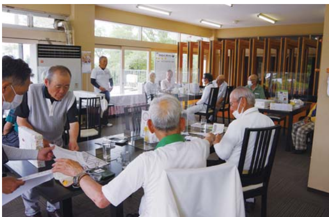
会長杯ゴルフ大会に参加した精鋭14名㊤。和気あいあいのひと時も㊦