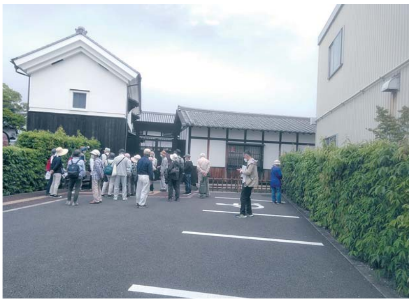
もりぐち歴史館はじめ市指定文化財をめぐる健康ウォーキング