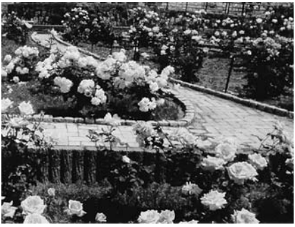
花博記念公園で歩こう会開催

たが、今年度は少しでも予定通りにと考えています。当日の天候が一番気になりながら、5月18日歩こう会を実施、花博記念公園に行っ