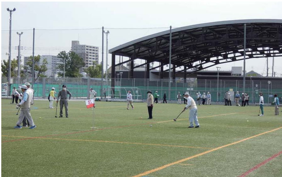
暑さに負けず和気あいあいのプレーを楽しむ参加者