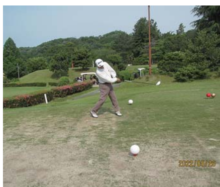
さすがのナイスショット!

ました猛者精鋭14人が集結し、検温、手指消毒、止に万全を期し、快晴かつ無風の中、暑い暑いと言いつつも競技に没頭された結果、