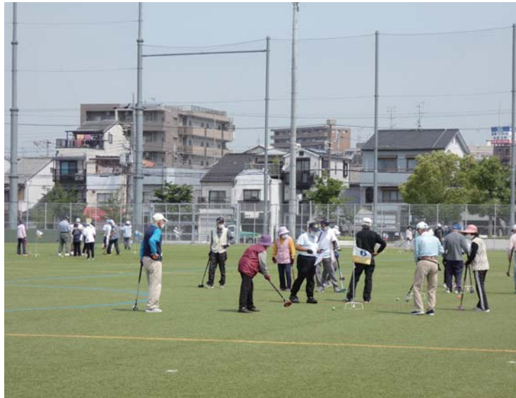
快晴の下、139名参加してグラウンドゴルフ大会

令和4年4月21日、南部コミュニティセンターにおいて、守口市老人クラブ連合会初の公式ワナゲの講習会が開催されました。参加者は73名で、コロナ禍でもありました。盛況でありました。 が、極力、感染防止につとめ、参加者全員「凄く楽しい！」と大盛況でありました。