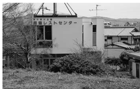
憩いの空間 淀川河川公園

この三つを新しい生活様式に取り入れて継続し、健康で長生きできるように、普段から健康に気を配り管理することが大切である。