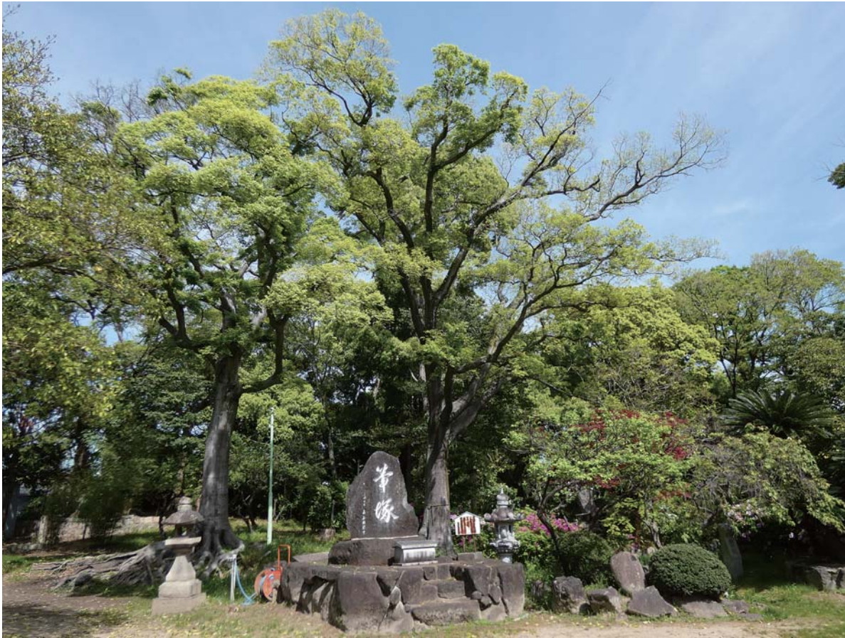
佐太天神宮 「大阪緑の百選」に認定されるほどの美しさと規模を誇っている。きれいな自然に癒されながら宿場町の風情を感じられる。