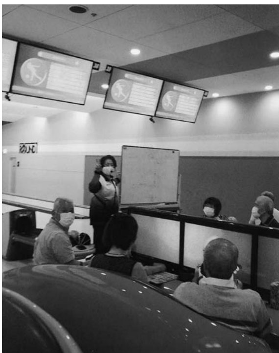
楽しみながら健康になれるボウリング