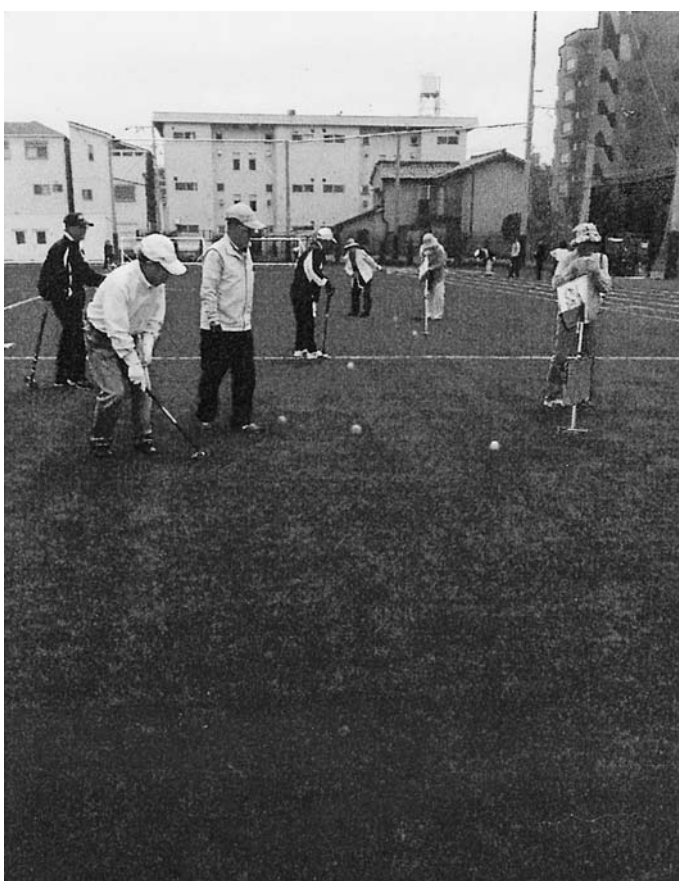
みんなが心待ちにしているグラウンドゴルフの練習日

東地区内のメンバーで毎月1回〜2回、よつば小学校グラウンドに集まってグラウンドゴルフの練習をしています。いつも40人〜50人ぐらゐの皆さんが参加されています。