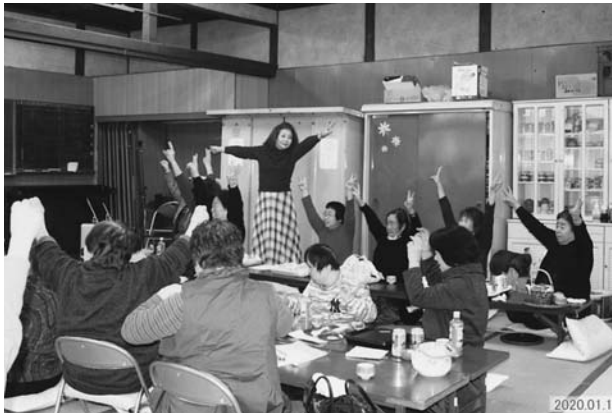
昨年開催できた唯一のイベントの「新年互礼会」

コロナウイルス感染症 は油断は出来ません が、三密・マスク・手 洗い・うがいに十分注 意しながら「うつさな い」、「うつらない」を 心掛け、日々の活動を 進めたく思います。