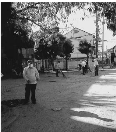
清掃ボランティア活動