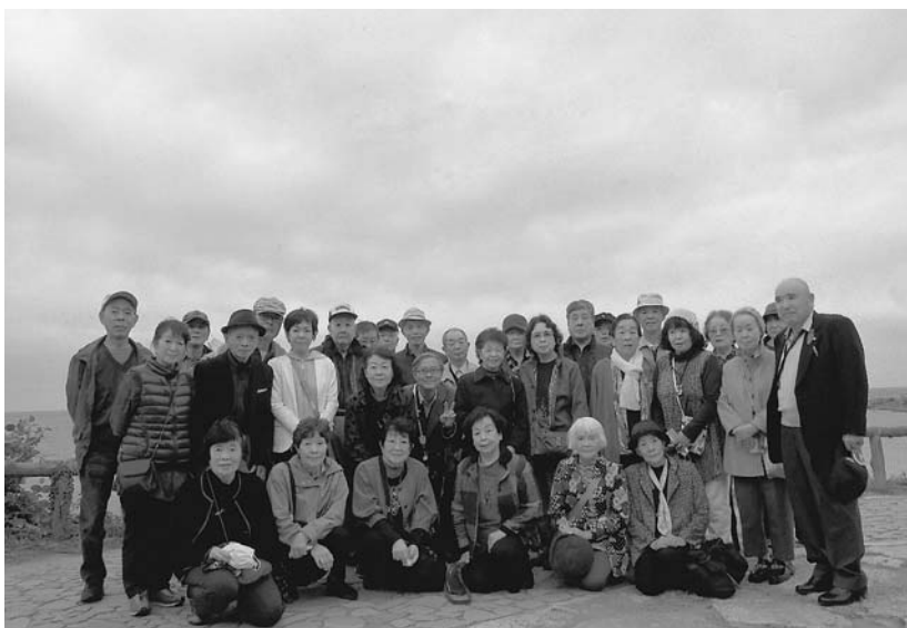
三方五湖梅丈岳展望台で記念撮影

令和2年10月21日(水) 行に出かけました。22日(木)、秋季親睦旅行 青天に恵まれて、行