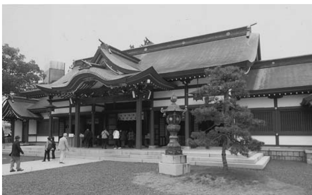
気比神社でコロナ根絶を祈願

だ森林の並木道は紅葉が少し早かったみたいでした。三方五湖梅丈岳展望台は天候も良くて、見渡す景色は絶景でした。そして若狭での昼食は大変おいしかったです。つづいて羽二重餅の古里見学では