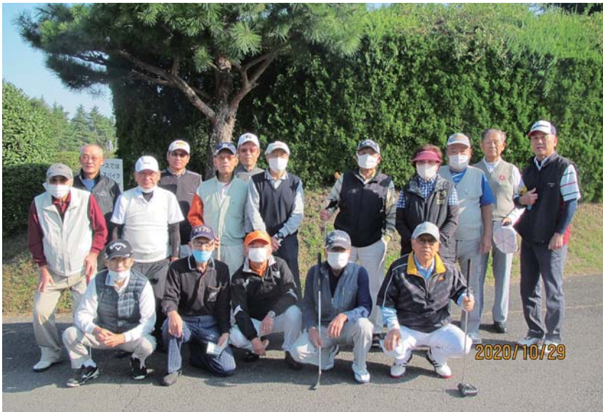
絶好のゴルフ日和に恵まれ第6回会長杯ゴルフ大会を開催

今年は、3月より新型コロナウイルス感染拡大により、守口市老人クラブ連合会の行事のほとんどが自粛、中止となりまして、この会長杯ゴルフコンペも当初5月