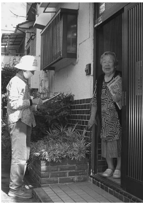
友愛訪問活動で地域の困りごと解決の手助けを

パンデミックの新型コロナウイルス感染症は、まだ収まらず日々増え続けている(10月4日現在、日本の状況は、感染者約8・6万人、死亡者約0・16万人、守口市の感染者約128人)。 1月以来、新型コロナ