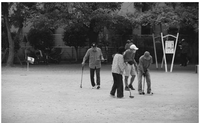
グラウンドゴルフはいつでも大人気