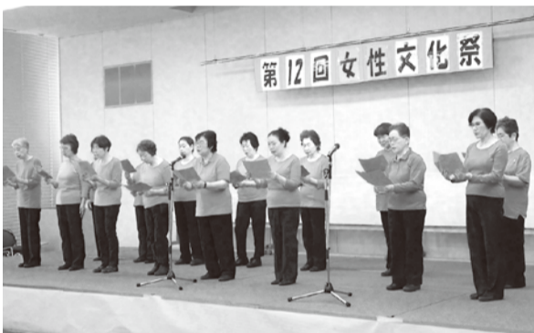
守口老連賛歌女性部