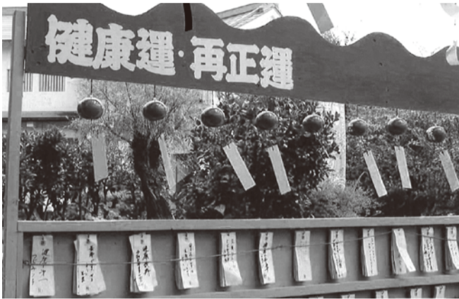
ぶどう狩り (上) 風鈴の音色も (下)