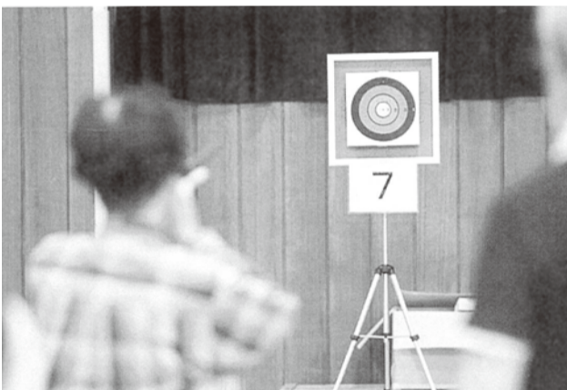
吹き矢で自然に身につく腹式呼吸

呼吸には「胸式呼吸」「腹式呼吸」があり、読んで字のごとく呼吸時に胸が膨らむのが「胸式」、お腹が膨らむのが「腹式」です。寝ている時、自然とお腹が膨らんだり、しぼんだり、しながら呼吸しています。歌手や腹式呼吸です。歌手や役者が大声を出す時も、この腹式呼吸を使い、声量や息のコントロールを行っていきます。お腹を動かすことで、代謝を促進する効果や、気持ちが悪くなるのを防いでくれます。酸素を多く摂取すると脳の動きにも影響します。さあ、吹き矢を実践してみませんか。