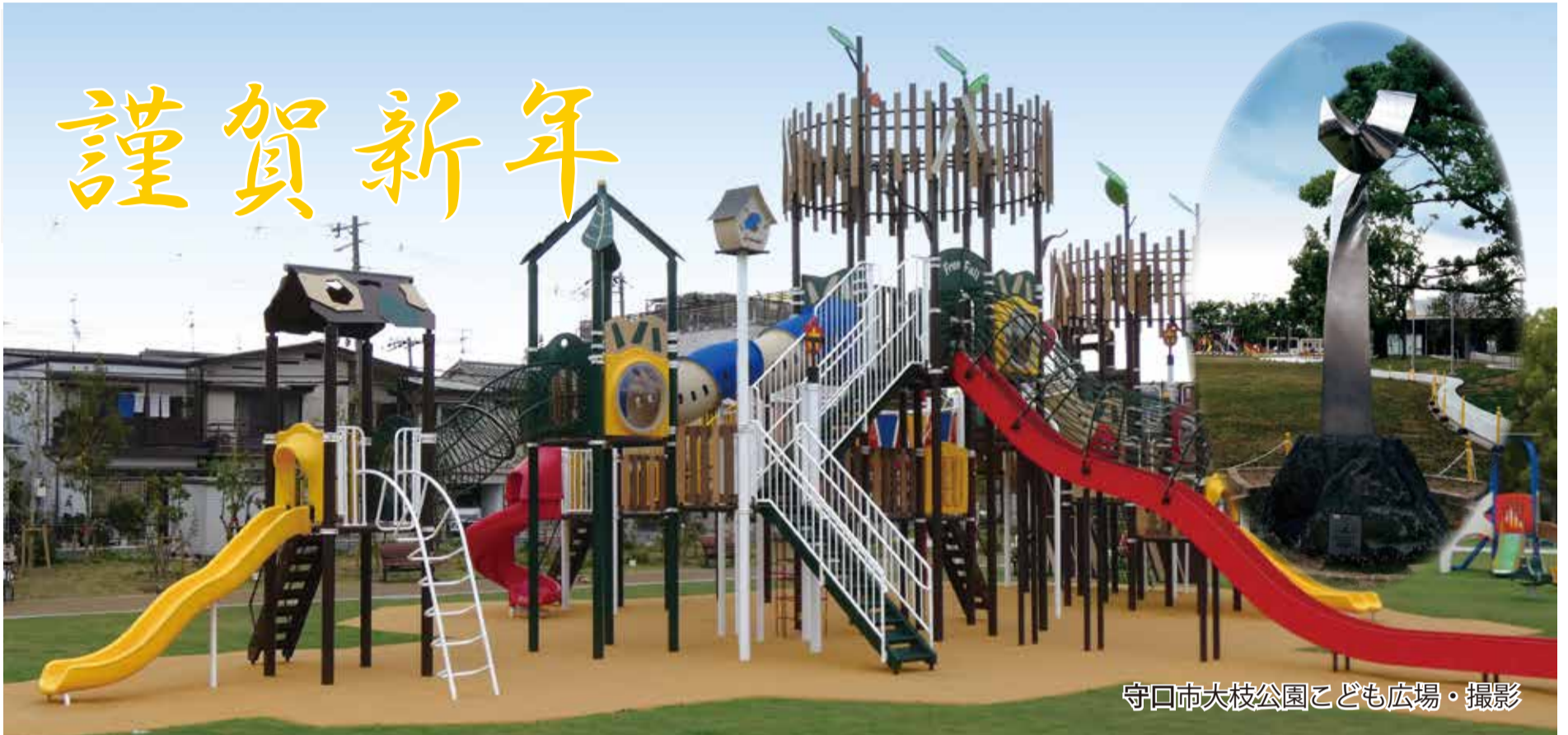
守口市大枝公園こども広場・撮影