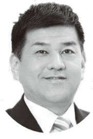
守口市長 西端 勝樹