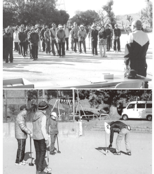
グランドゴルフ大会

退院する頃には、 母も肺がんで死去し 「生まれた家」も無 く、優しい先輩のお 世話で「文化住宅」 に落ち着く事ができ ました。その後、結 核し商社での営業を 頑張り40歳で起業を しました。今日、こ うして元気に生活を 送れるのも「先輩・ 友人」の協力&アド バイスが有ればこそ と感謝・感激してい ます。起業し5年程 した頃、友人からの お誘いで「管理組合 役員」自治会役員、 梅花会会長、地域役 員「など、僕でもお 役に立てればとお受 けし頑張っています。 *長い人生、助けら れたり&助けたりで す、これからも体力 続く限り頑張ります。 公私ともに充実した 日々が送れます様 に!!